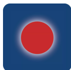
Оранжевый или красный свет становится видимым только при включении

Благодаря передовому интерференционному покрытию