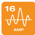
Connects to any 16A (3 phase) charging unit or station with a type 2 connection.

Charge at home and on the move Type 2 to Type 2 PIN | 3PHASE