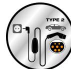
Charge at home and on the move

Эргономичные ручки для оптимального управления, кабель длиной 5 метров