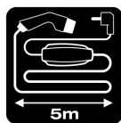
5m cable length

Variable charging rates of 1.3/2.2/3.6 kWh meet individual charging requirements